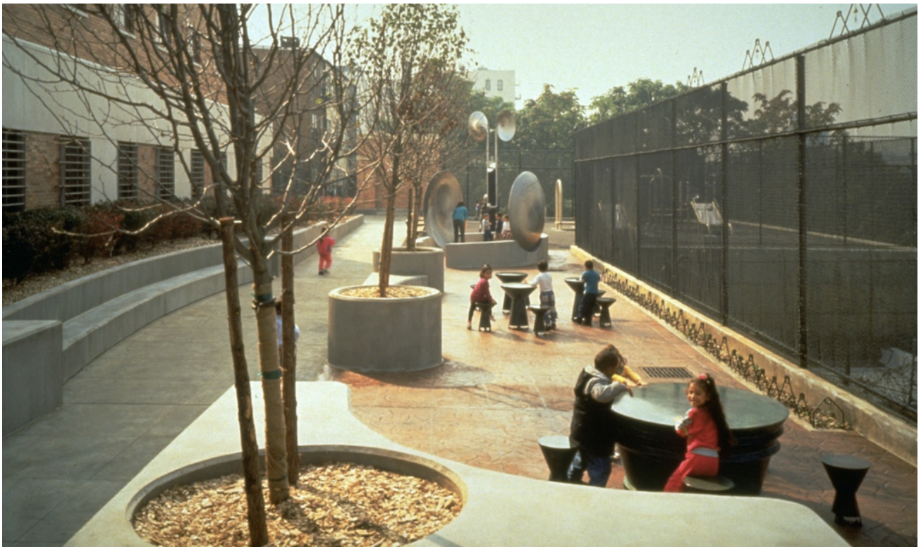
Sound Playground, 1992. Beeld: Paul Warchol, PS23