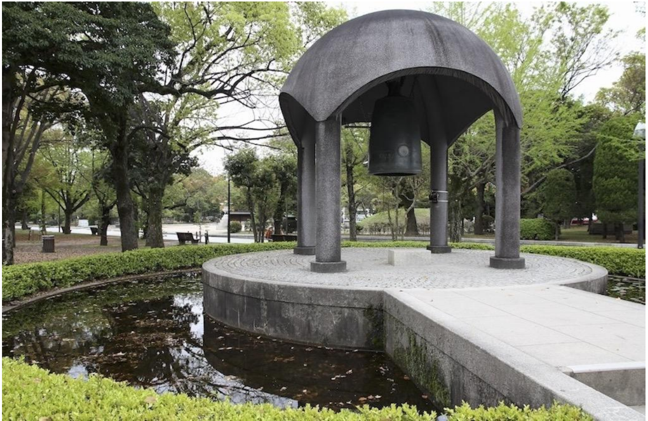
The Hiroshima Peace Bell.