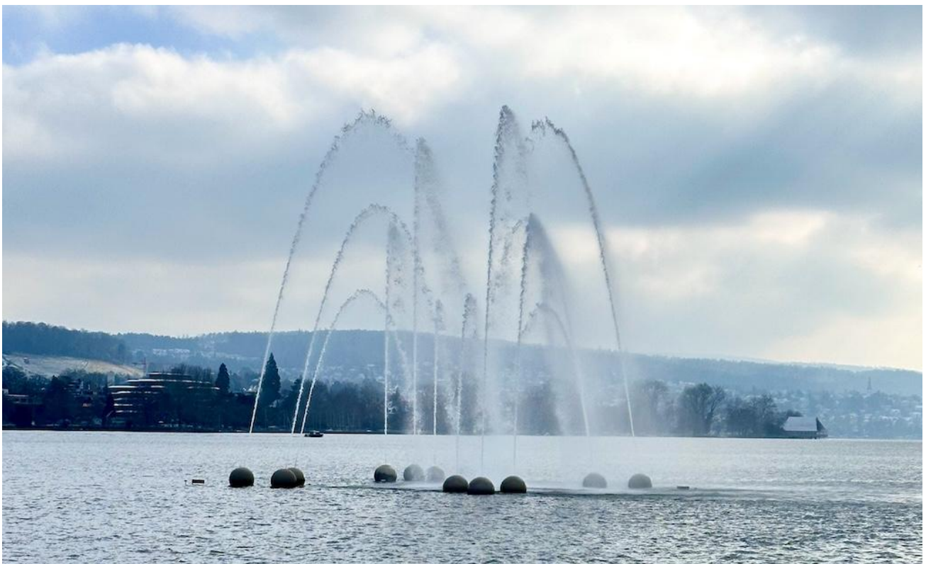
Aquaretum, Zürich.